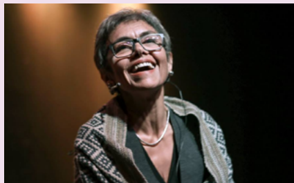
BIBLIOTECA MUNICIPAL MANUEL ALEGRE – ÁGUEDA

Promotor Biblioteca Municipal de Albergaria-a-Velha Público-alvo Comunidade Leitora em Geral