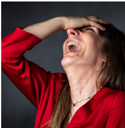
BIBLIOTECA MUNICIPAL DE SEVER DO VOUGA