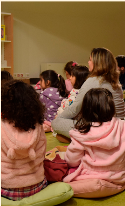
BIBLIOTECA MUNICIPAL DE ALBERGARIA-A-VELHA