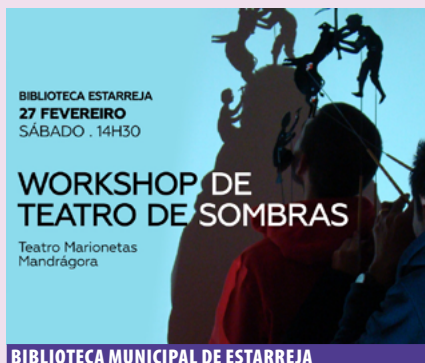
BIBLIOTECA MUNICIPAL DE ESTARREJA

Horário(s) 15h00-18h00 Promotor Biblioteca Municipal de Sever do Vouga Público-alvo Maiores de 16